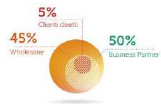
provenienza nuove attivazioni